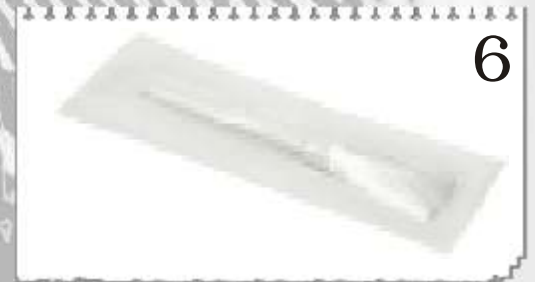
6 9772B : BROSSE FIBRE DE VERRE A USAGE UNIQUE