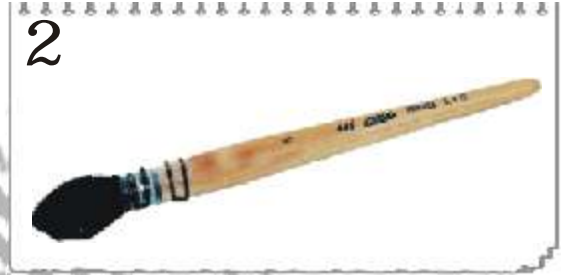
2 PETIT GRIS EXTRA FIN 449/3 : DIAMÈTRE 8 mm 449/5 : DIAMÈTRE 10 mm 449/8 : DIAMÈTRE 14 mm