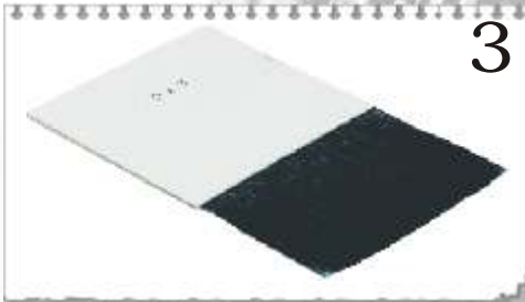
3 44/60 : PALETTE PETIT GRIS EXTRA FIN