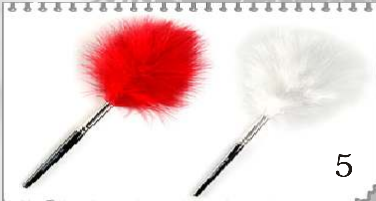
5 B123 : BROSSE PLUME EN DUVET DE MARABOUT BLANCHE B518 : BROSSE PLUME EN DUVET DE MARABOUT ROUGE