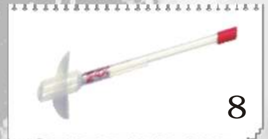
8 9503 P : PINCEAU MAGNÉTIQUE