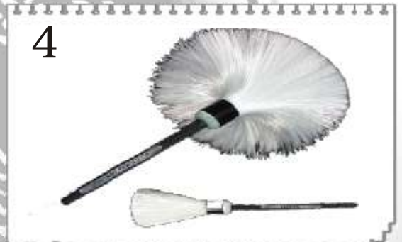
4 B122 : BROSSE FIBRE DE VERRE LONGUEUR DU POIL 62 mm