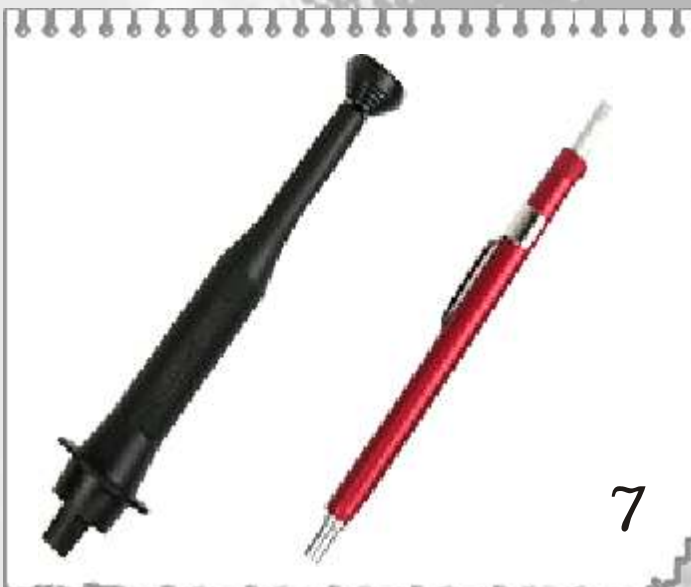
7 8303P : PINCEAU MAGNÉTIQUE GRAND MODÈLE B517 : PINCEAU MAGNÉTIQUE PETIT MODÈLE