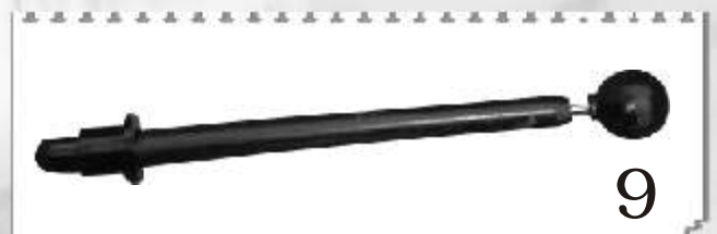
9 9398P : PINCEAU MAGNÉTIQUE